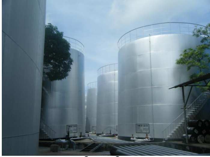
জালানি তেলের ডিপোসমূহ