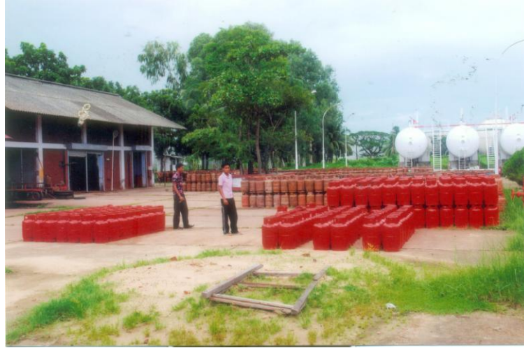
এলপিজি বটলিং প্ল্যান্ট