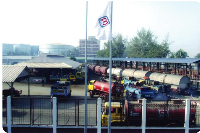
প্রধান স্থাপনা, এমপিএল