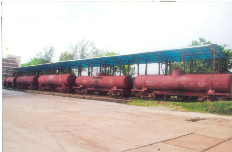
তেল পরিবহনের জন্য ব্যবহৃত ওয়াগন