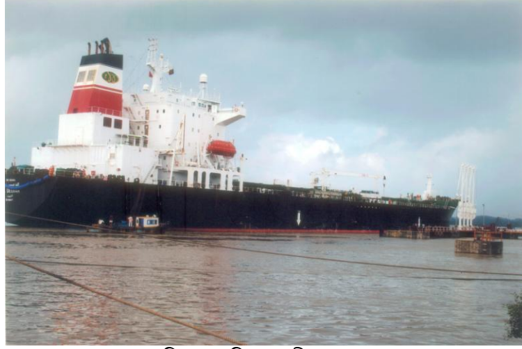
জ্বালানি তেল পরিবহনকারী মাদার ভেসেল