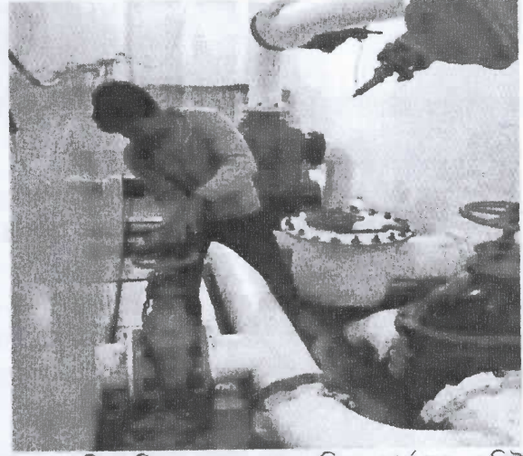
চিত্র-২: পরিশোধিত তেল আমদানির কার্যক্রম মনিটরিং কমিটির সদস্য-সচিব কর্তৃক গেট ভাভ পরিদর্শন।

৩। ২০২২-২০২৩ অর্থ বছরের বার্ষিক কর্মসম্পাদন চুক্তি অনুযায়ী জুলাই-আগস্ট ২০২২ সময়ের পরিশোধিত তেল আমদানির লক্ষ্যমাত্রা ও অর্জনের বিবরণ নিম্নরূপ: